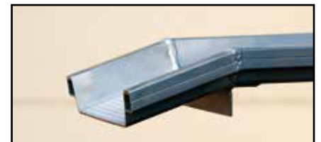
Lèvre d'appui avec butée pour une meilleure stabilité